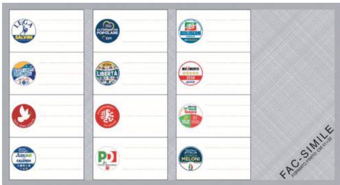
Fac simile scheda elettorale elezioni europee