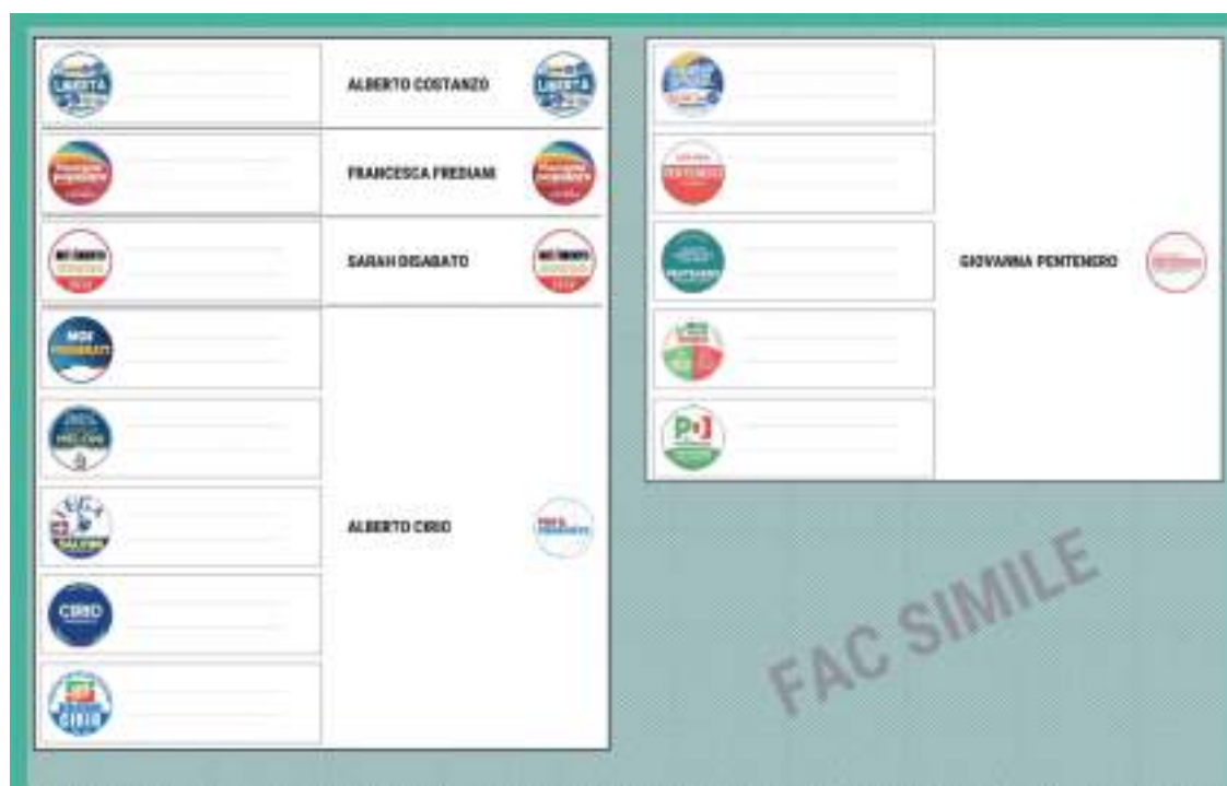
Fac simile scheda elettorale Regione Piemonte

Stesso modus operandi per le elezioni Regionali e Amministrative.